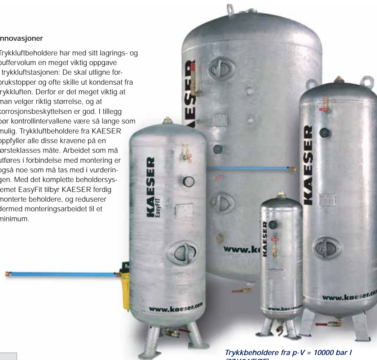
Trykkbeholdere fra p-V = 10000 bar I (87/404/EØF)

Trykkluftbeholdere har med sitt lagrings- og buffervolum en meget viktig oppgave i trykkluftstasjonen: De skal utligne forbrukstopper og ofte skille ut kondensat fra trykkluften. Derfor er det meget viktig at man velger riktig størrelse, og at korrosjonsbeskyttelsen er god. I tillegg bør kontrollintervallene være så lange som mulig. Trykkluftbeholdere fra KAESER oppfyller alle disse kravene på en førsteklasses måte. Arbeidet som må utføres i forbindelse med montering er også noe som må tas med i vurderingen. Med det komplette beholdersystemet EasyFit tilbyr KAESER ferdig monterte beholdere, og reduserer dermed monteringsarbeidet til et minimum.